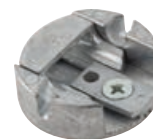
podešavanje sa stražnje strane