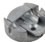
podešavanje s prednje strane