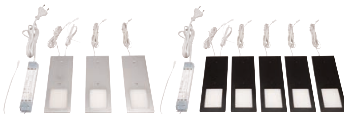
Set 3 kom boja aluminija